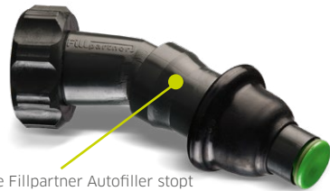
De Fillpartner Autofiller stopt automatisch met vullen.