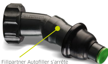
Le Fillpartner Autofiller s'arrête automatiquement.