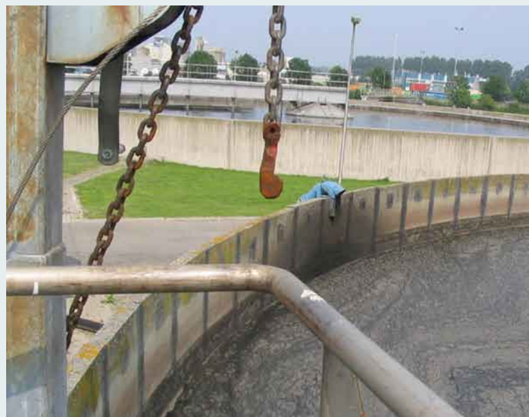
Bassin van een zuiveringsinstallatie

In de periode van 2005 tot heden zijn 70 meldingen geregistreerd van min of meer ernstige ongevallen. Aan te nemen valt dat het gaat om het 'topje van de ijsberg'. Enkele voorbeelden zijn: oogletsel door vallende takken, vingers bekneld bij resp. werkzaamheden met een kraan, tillen van afdekplaten op een begraafplaats, in een vuilpersinstallatie en bij het afmeren van een