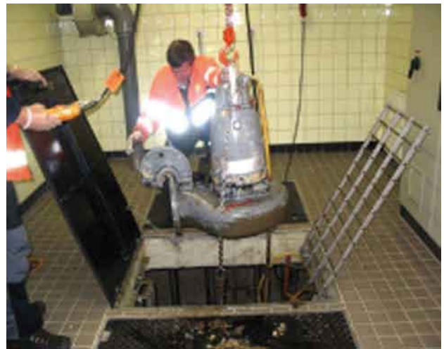
Uittakelen van pomp bij gemaal